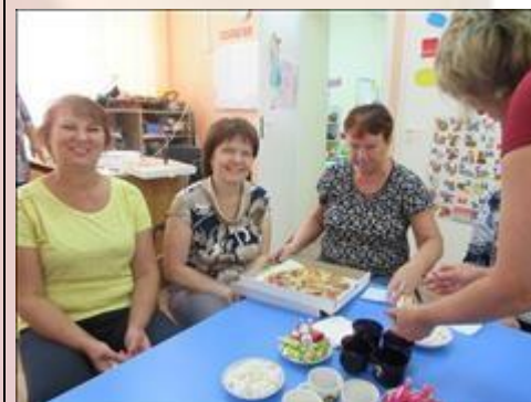
Кофе-пауза во время обучающего семинара-тренинга "В детский сад пришел приемный ребенок" Фотография сделана во время кофе-паузы.