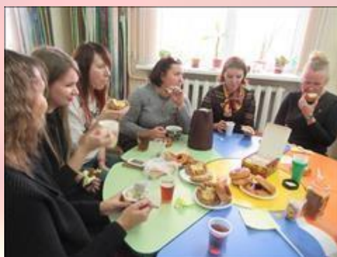
участники семинара Фотография сделана во время кофе-паузы