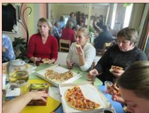
участники семинара Фотография сделана во время кофе-паузы