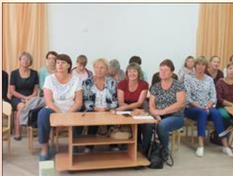
Участники обучающего семинара для специалистов детских садов "В детский сад пришел приемный ребенок" На фотографии специалисты детского сада № 46 гор. Пудожа