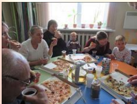
Участники семинара Фотография сделана во время кофе-паузы