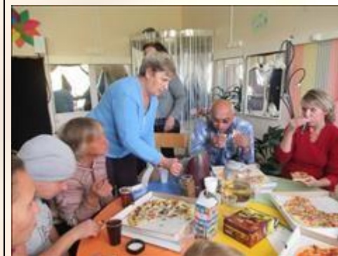
участники семинара Фотография сделана во время кофе-паузы