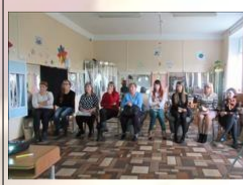
участники семинара Фотография сделана во время проведения семинара