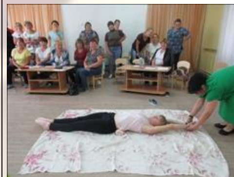
Упражнение на профилактику эмоционального выгорания.