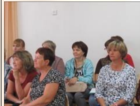
Обучающий семинар для специалистов детских садов "В детский сад пришел приемный ребенок" Участники семинара. Воспитатели детских садов Пудожского района.