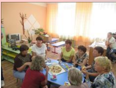
Кофе-пауза во время обучающего семинара "В детский сад