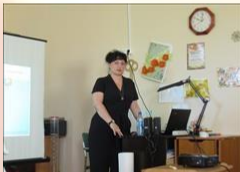
ведущая семинара Фотография сделана во время проведения семинара.

Электронные версии материалов (бюллетеней, брошюр, буклетов, газет, докладов, журналов, книг, презентаций, сборников и иных), созданных с использованием гранта в отчетном периоде (при условии, что такие материалы не содержатся в материалах, указанных в подпункте 5 настоящего пункта)