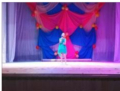
Концерт Ярослава Алексева исполняет "Нежность"