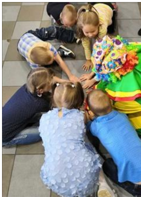
Участники Клуба принимающих семей Ребята играют в игру.