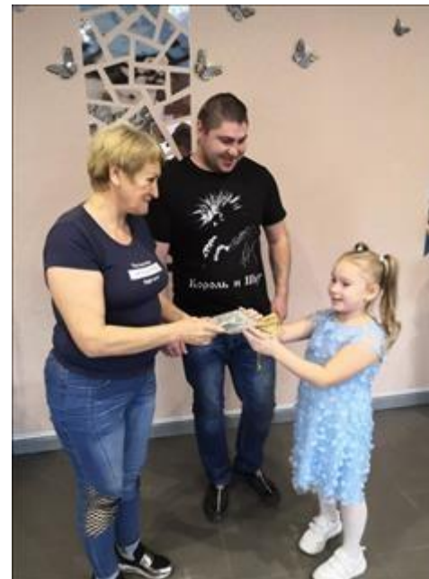
Участники Клуба принимающих семей Участники Клуба обмениваются подарками и теплыми пожеланиями (семья Б и семья А)