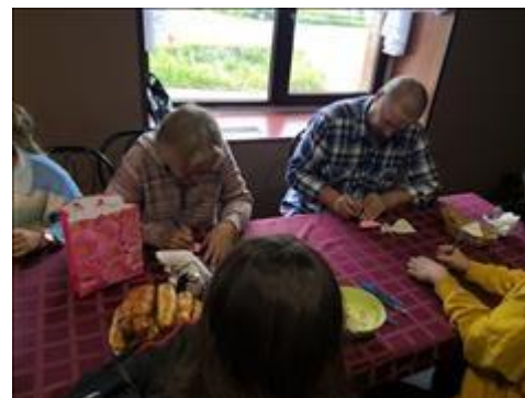
Клуб принимающих семей Участники Клуба участвуют в развлечении "От сердца к сердцу"