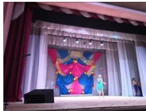
Концерт Ярослава Алексеева «Я грею счастье».