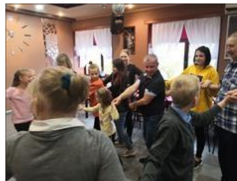
Клуб принимающих семей Участники играют в игру "Пуганка"