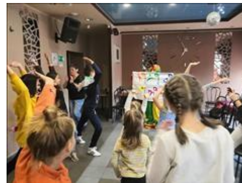
Клуб принимающих семей Участники Клуба участвуют в одном из развлечений