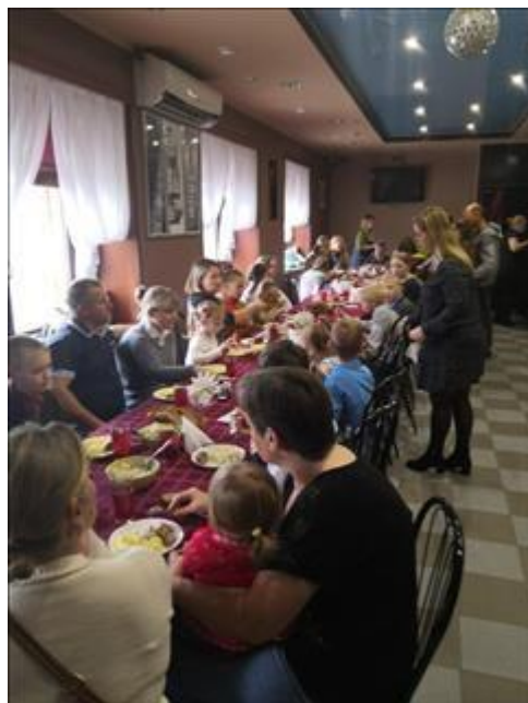
Клуб принимающих семей Участники Клуба во время обеда.