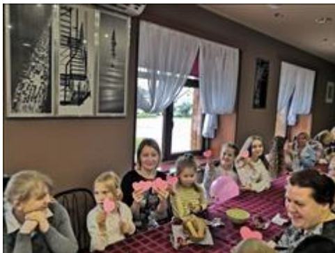
Участники Клуба принимающих семей На фотографии участники Клуба принимающих семей участвуют в развлечении "От сердца к сердцу"