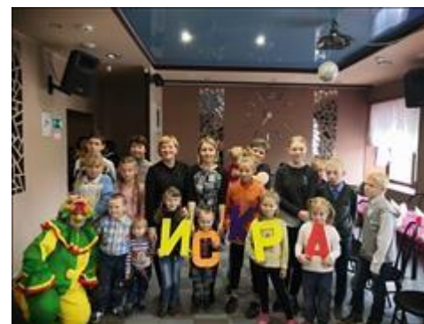
Клуб принимающих семей На фотографии участники Клуба после проведения одного из развлечений