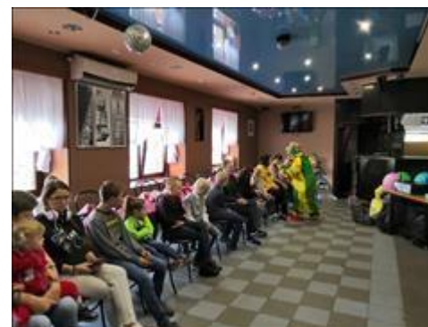
Клуб принимающих семей На фотографии участники Клуба во время проведения мероприятий в кафе Ностальжи