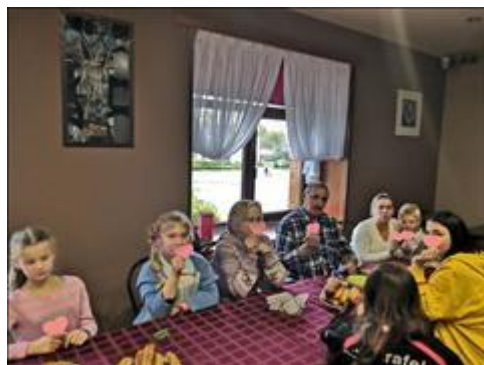
Клуб принимающих семей Участники во время развлечения "От сердца к сердцу"