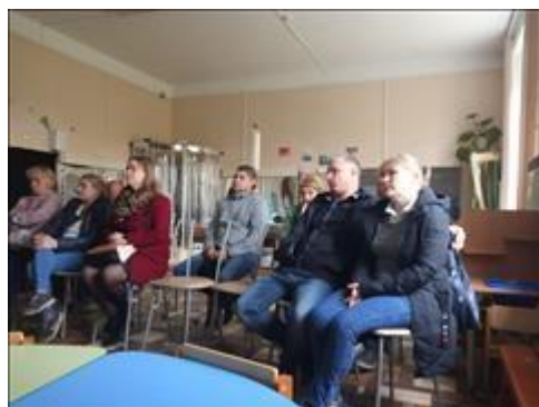
Участники Клуба принимающих семей Родители в ходе обучающего семинара. Внимательно слушают ведущую.