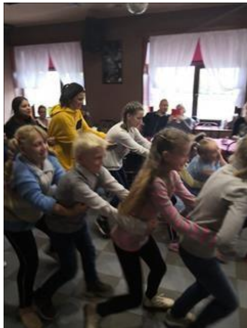
Клуб принимающих семей На фотографии участники Клуба участвуют в одном из развлечений.