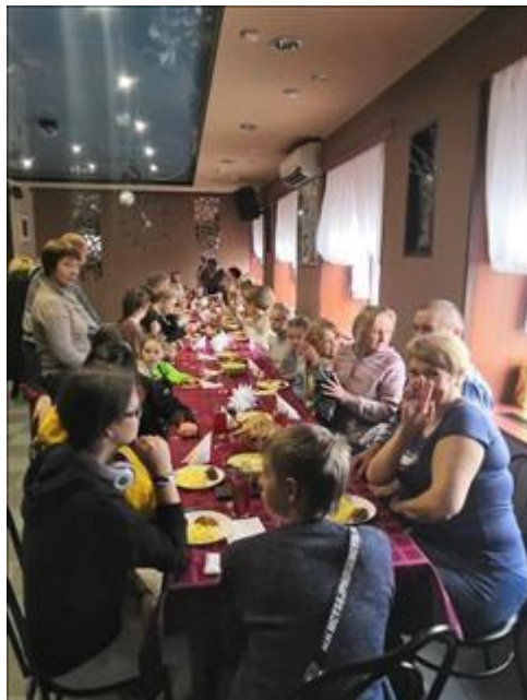
Клуб принимающих семей Участники Клуба во время обеда