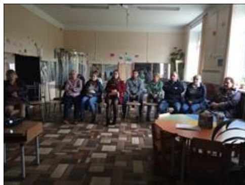
Клуб принимающих семей На фотографии участники на теоретической части Клуба.