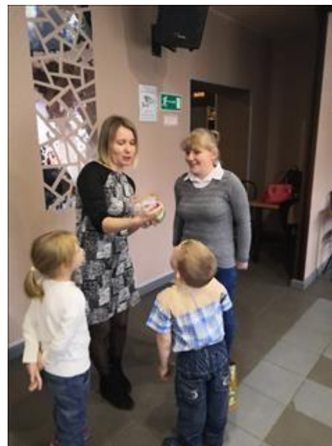
Клуб принимающих семей На фотографии семья М передает подарок и теплые слова семье Б.

Количество публикаций за весь срок осуществления проекта